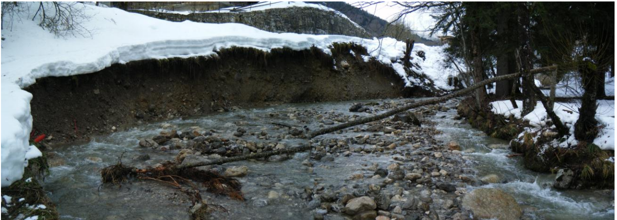
Erosion de berges à Aillon le jeune (la Correrie) avec mise à nu des réseaux et menace sur une habitation.

Après diagnostic, l'apport de l'équipe technique associée à une équipe rivière permet de proposer une réponse technique durable ( génie végétal et/ou techniques mixtes ), adaptée aux contraintes réglementaires et environnementales, tout en diminuant les coûts résiduels pour les communes sur des travaux inéligibles à des subventions ( Protection des biens et des personnes ).