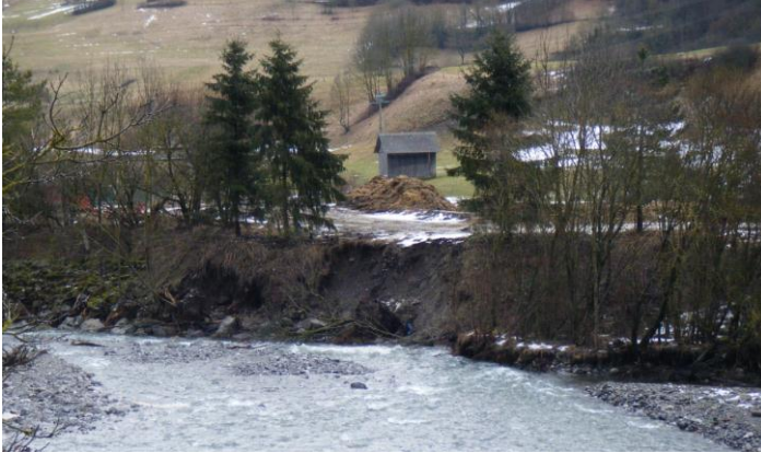
Erosion de berges à la Compôte à proximité d'un chemin rural (usages).

Plusieurs exemples concrets sont évoqués concernant de petites problématiques de restauration de berges sur lesquelles le SMIAC a été interpellé récemment par les communes ( Rumilly, Aillon le jeune et la Compôte ).